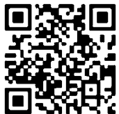
スマートフォン用HP