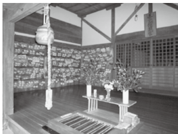
軽部神社絵馬奉納の様子

遠方の方に対応するために、当商工会青年部が代行奉納させていただくものです。奉納後、「奉納した絵馬を撮影した写真」と軽部神社にちなんだ「おっばいせんべい」をお送りさせていただきます。