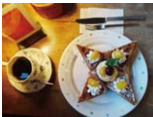
お勧めのコーヒーとワッフル