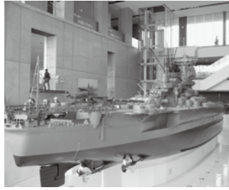
大和ミュージアム内の戦艦「大和」(10分の1サイズ)

12月1日(日)、総勢40名のご参加をいただき、広島県呉市へ親睦旅行に行きました。大和ミュージアム・てつにくじら館の見学では歴史と技術を感じ、昼食は日招きの里で地産地消(肉じゃが等)を食した後、呉港クルージング(潜水艦・戦艦ドック)と千福酒造(製造工程)にて皆さんと一緒に体験等を行い、会として親睦を深めることができました。