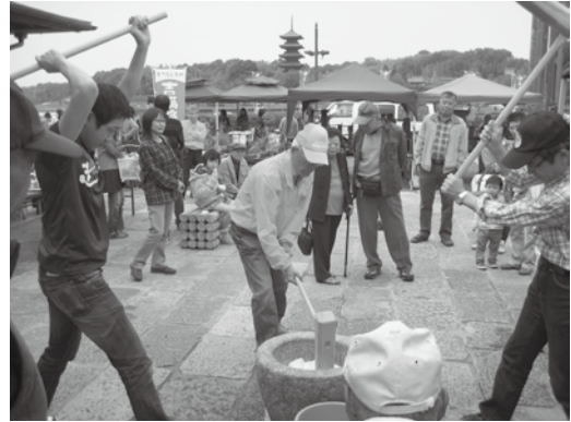
五重塔をバックに一生懸命餅つき中!

餅つき実演販売では役員、女性部、地元の餅つき名人達の手により約1俵のもち米を杵でつき、あっという間に完売しました。会員出店の店とフリーマーケットも大盛況でした。5月に「春の感謝祭」を予定しています。お楽しみに!