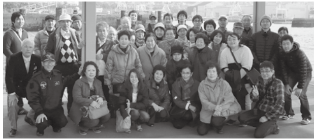
呉港クルージング後の集合写真