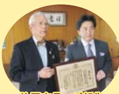
片岡市長へご報告

最後となりましたが、会員皆様のご健勝とご多幸をお祈りし、新年のご挨拶とさせていただきます。