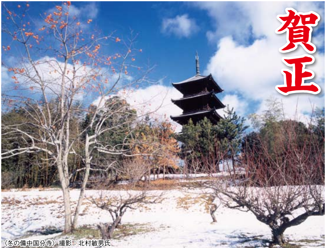
〈冬の備中国分寺〉

締切…平成26年2月28日(金) ご応募は総社吉備路商工会まで! ※詳細は商工会HPにてご確認ください。