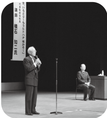
講師を紹介する吉澤会長