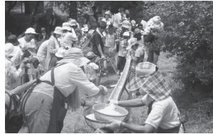
涼しげな流しそうめんをキャッチ