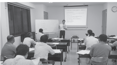
熱心に聞く参加者

6月21日、26日、平成25年度若手後継者等育成事業として「営業力向上セミナー」を実施しました。第1回目では「突破力を身につけるために」、これから必要な能力や、営業の本質、基礎を中心に学びました。第2回目では「問題解決力・現場対応力を身につける」、心(セールス・マインド)・技(セールス・スキル)・体(セールス・アクション)を鍛え、セールスサイクルやセールスプロセスを習得することを学びました。