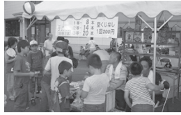
子供達に人気のおもちゃのくじ引き

福山合戦太鼓、盆踊り等が行われ、屋台も多く出店します。気軽に参加でき楽しむことができる夏祭りです。