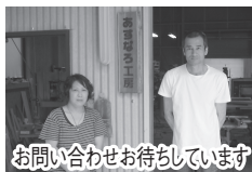
お問い合わせお待ちしております

総社市：たね井や、吉備路もてなしの館、吉備の里、サントピア岡山総社 など その他：高梁市、倉敷市、吉備中央町、岡山市東区 などの指定場所にて