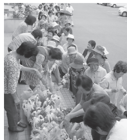
プレゼントの様子

6月6日、ゴキブリ駆除用のホウ酸団子をペットボトルのキャップを再利用して作りました。毎年、「商工会の日」PRのために行っている活動です。山手地区では、6/9(日)PR事業として、ホウ酸団子と花の苗を先着100名様にプレゼントしました。毎年ご利用頂いている方々には、ゴキブリ駆除にとてもよく効くと、喜ばれています。