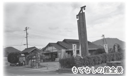
もてなしの館全景

吉備路もてなしの館は、吉備路観光の拠点施設として平成16年3月21日にオープンしました。その後、平成19年4月より総社市の指定管理者として「おもてなしの精神」で当商工会が運営を行っています。