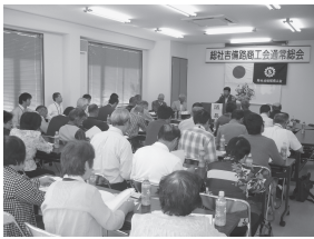
議案を慎重に審議する会員