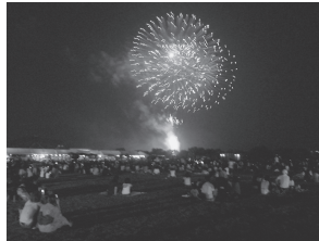
フィナーレの打ち上げ花火は最高

と き：7月27日(土) 雨天順延 28日(日) と ころ：高梁川清音河川敷グラウンド