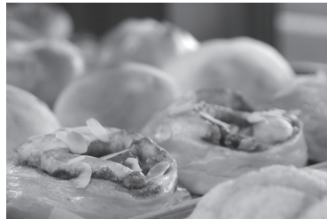
焼きたての手造りパン

おっぱい神社ごと軽部神社にちなんだ「おっぱいパン」でお馴染みの「手造りパン 麦ばたけ」が旧店舗すぐ向かいに新しくオープンしました。かわいく木のぬくもりが感じられるお店にはウッドデッキもあり、その場で焼きたてのパンを楽しむことができます。一押しは何と言っても「吉備路れんげ米」を使った「米粉パン」です。もちもちとした食感がたまらない逸品です。吉備路のおみやげに、ぜひご利用ください。