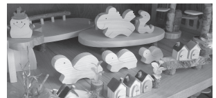
可愛らしい動物たち

高梁川のせせらぎが聞こえ、木々に囲まれた自然の中ご夫婦2人で製作されています。国産の無垢の木を用いて、「樹と人」「家具と人」との親しく長い関係を実感できるように皆様のご希望に沿った家具を創り上げています。ご主人は家具中心の製作で、小物製作は奥さんが担当しています。女性目線ならではの何とも可愛らしい動物などはお母さんにも子供たちにも大人気です。家具は注文製作でひとつひとつ丁寧に、小物は販売店やイベント等で販売していますので一度見て、触って、感じて、皆さんのお気に入りを見つけてください。(⇒ブログ『あすなる工房 momo』で検索)