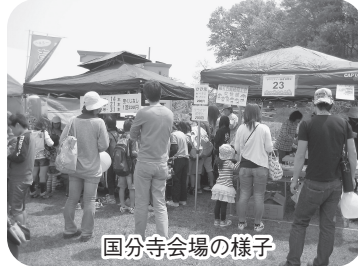
国分寺会場の様子

4月29日(月)、備中国分寺一帯で「第28回吉備路れんげまつり」が開催され、多くの家族連れが「れんげ」と「イベント」で春の吉備路を満喫しました。女性部等が出店した吉備路もてなしの館も終日多くの人が訪れ大盛況でした。