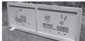
可愛い切抜のついたて