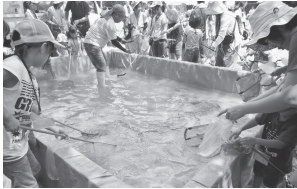
鮎をすくって、その後塩焼きへ