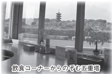
飲食コーナーからのぞむ五重塔

吉備路もてなしの館は、吉備路観光の拠点施設として平成16年3月21日にオープンしました。その後、平成19年4月より総社市の指定管理者として「おもてなしの精神」で当商工会が運営を行っています。