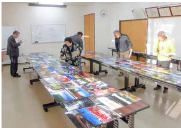
慎重審査の結果、26名が入賞