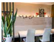
店内は西洋風で 落ち着いた雰囲気

昨年6月に総社市清音に洋食屋「五感」をオープンしました。「五感」という名前は、毎日、地元の産直市場から仕入れた採れたての野菜や地魚、そして国産にこだわったお肉など、新鮮な旬の食材を取り入れ、お客様が五感を使って、食材の持つ本来の美味しさを味わっていただきたいと思い、名付けました。週替わりで提供するランチは、シェフオリジナルの Pasta がメインの「Pastaランチ」とお肉料理がメインの「五感ランチ」の2種類です。また、ディナーは予約でコースも用意でき、ご予算に応じてご対応させていただきますので、是非一度、洋風厨房「五感」へお越しください。