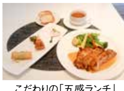
こだわりの「五感ランチ」