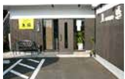
黄色の看板が目印です