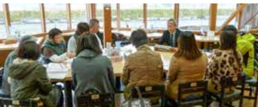
おもてなしの準備