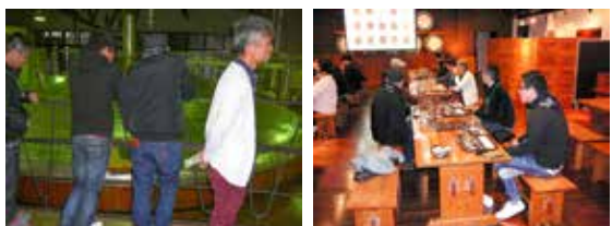
蒸留器の大きさにオドロキ! ウイスキーの工程について勉強中

11月9・10日と青年部で視察研修に行きました。1日目は西日本で行ってみたい工場ランキングで1位をとったサントリー山崎蒸留所に行き、仕込み・発酵・蒸溜・貯蔵の一連の工程を見学しました。次に日本遺産として登録されている舞鶴の赤レンガ倉庫群に行き、当時(1900年代初め)の4大軍港としての歴史的な価値の創造や魅力ある観光地の取組について勉強しました。2日目はUCC神戸工場へ見学に訪れ、ジャマイカ・ブラジル等の現地での品質管理の取組や「スーパーアロマ製法」という香り成分を逃がさない独自の技術の話などを聞き、ものづくりに対する熱い情熱と志を感じた2日間でした。