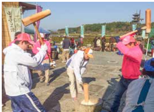
お餅も気持ちも熱い!

11月12日、当日は晴天に恵まれ、多くの来場者のもと賑やかに「餅つき」が行われ、つきたてのお餅はとろけるように柔らかく、あんことよく絡んで絶品でした。「おいしい、おいしい」とニコニコしながら食べている姿に、おもてなしの喜びを感じました。