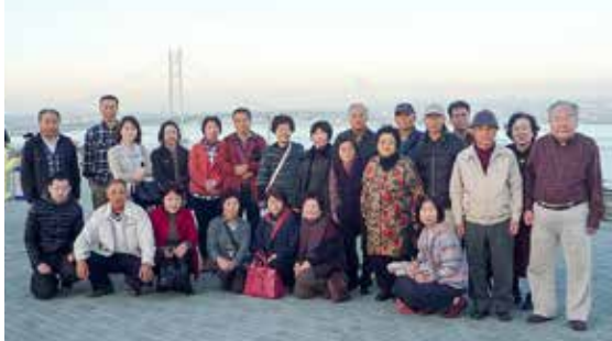
明石海峡大橋をバックに記念写真

12月3日、会員等24名で淡路島方面へ行きました。「大塚国際美術館」にて陶板の名画を鑑賞した後は昼食を挟み、「北淡震災記念公園」を見学。「吹き戻しの里」では吹き戻し作り体験を行いました。誰もが一度は遊んだ玩具で懐かしく充実した1日を過ごしました。