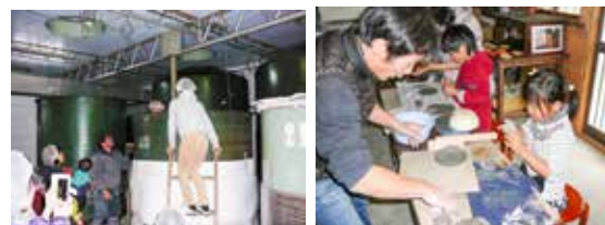
②ヨイキゲン「酒蔵見学」 ③陶工房 太田「備前焼小皿作り」