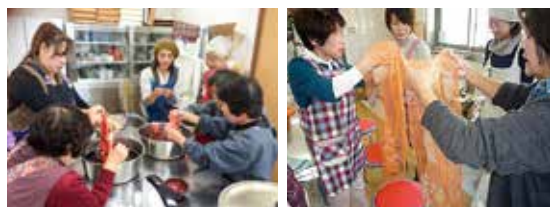
どんな柄になるかな? オリジナルのストール(橙色)