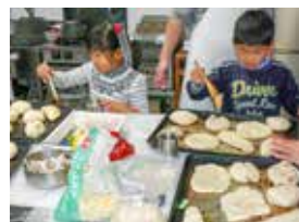
①麦ばたけ「パン作り」