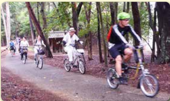
風を切って走る参加者