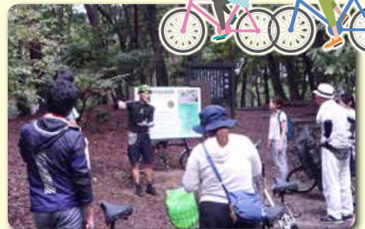
コーディネーターによる説明