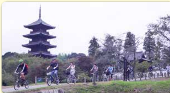
五重塔をバックに走る参加者