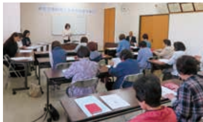
赤木部長より開会挨拶

商工会の会員たる商工業者もしくはその配偶者又は、親族、従事する者、 女性部の趣旨に賛同する者