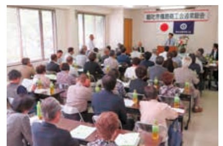
議案を慎重に審議する会員