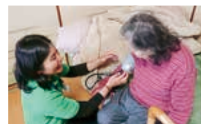
患者様に寄り添って心を込めて看護いたします。