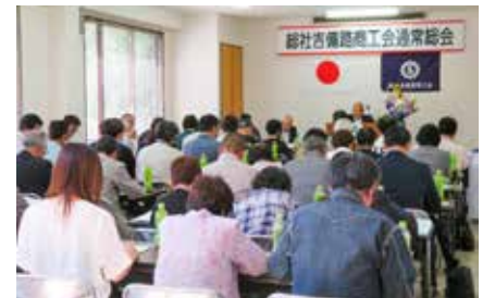
議案を慎重に審議する会員