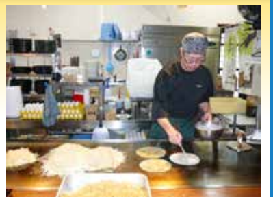
【心を込めて1枚1枚丁寧に焼き上げます】

「三八」という名前は広島流お好み焼きの名店「三八松浦」(2年連続ミシュランガイド広島特別版「ミシュランプレート」に選ばれている)で修業し、のれん分けをしてもらい、本場の味を地元の方にも食べていただきたいという思いで、総社市に昨年3月にオープンしました。当店のお好み焼きは千切りした大盛りのキャベツ(250g以上)と本家より伝授された味付けが特徴です。おすすめは、海鮮のトッピングで生いか、生エビ、生ホタテはお好み焼きとの相性も良く、当店の一番人気メニューです。味もボリュームも満足していただける当店自慢のお好み焼きをぜひ一度ご賞味ください。お持ち帰りもOKです。